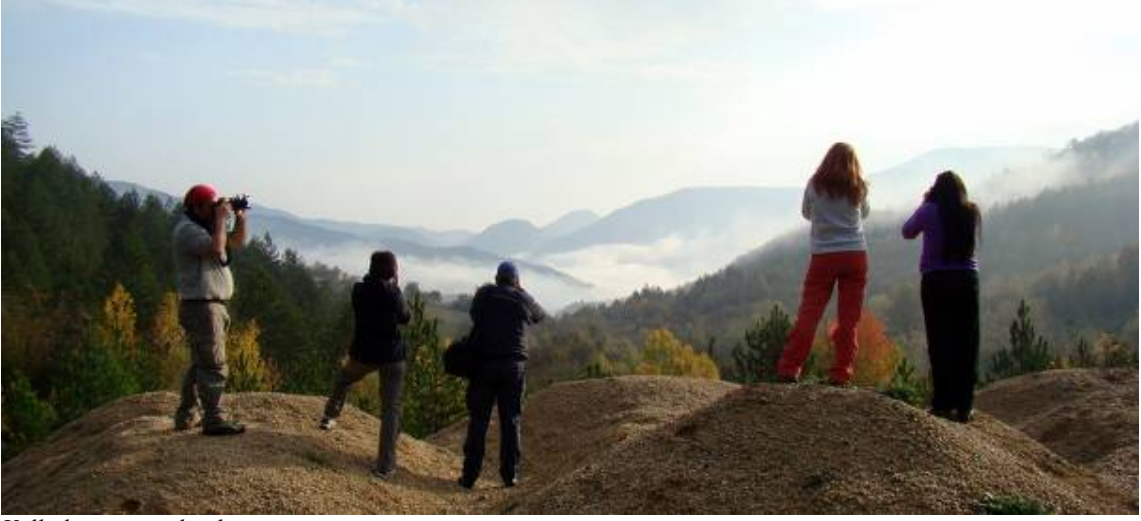
Valla kanyonu yolundan

Saat 10.20'de Valla kanyonu seyir terasına giden patika yolun girişindeki Muratbaşı köyüne ulaşıyoruz. Yürüyerek köy içinden geçip kanyonun görkemini daha iyi görebileceğimiz seyir terasına doğru patika yoldan gidiyoruz. Saat 11.15 gibi seyir terasına ulaşıyoruz.