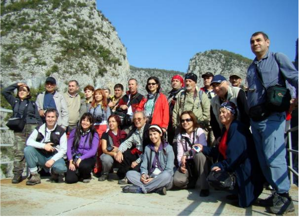
FSK, arkada Valla kanyonu

Saat 12.30 gibi Muratbaşı köyünden ayrılarak öğle yemeğini yiyeceğimiz Ilıca şelalesinin yakınındaki Parkılıca tesislerinde doğru geldiğimiz yoldan gidiyoruz. Işık, sabahki gibi iyi olmadığı için dönüşümüz daha hızlı oluyor.