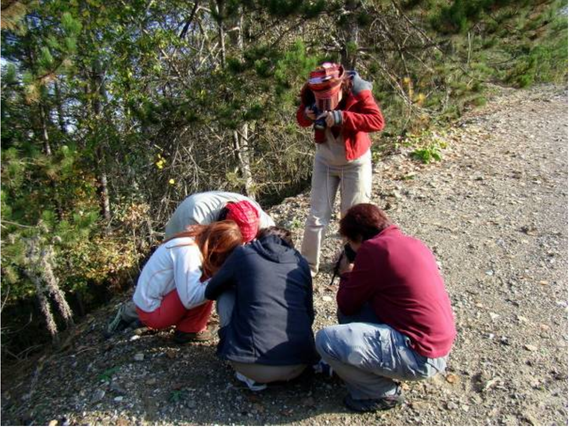
Her zaman çekilecek bir şey ve herkesin farklı bir bakışı vardır