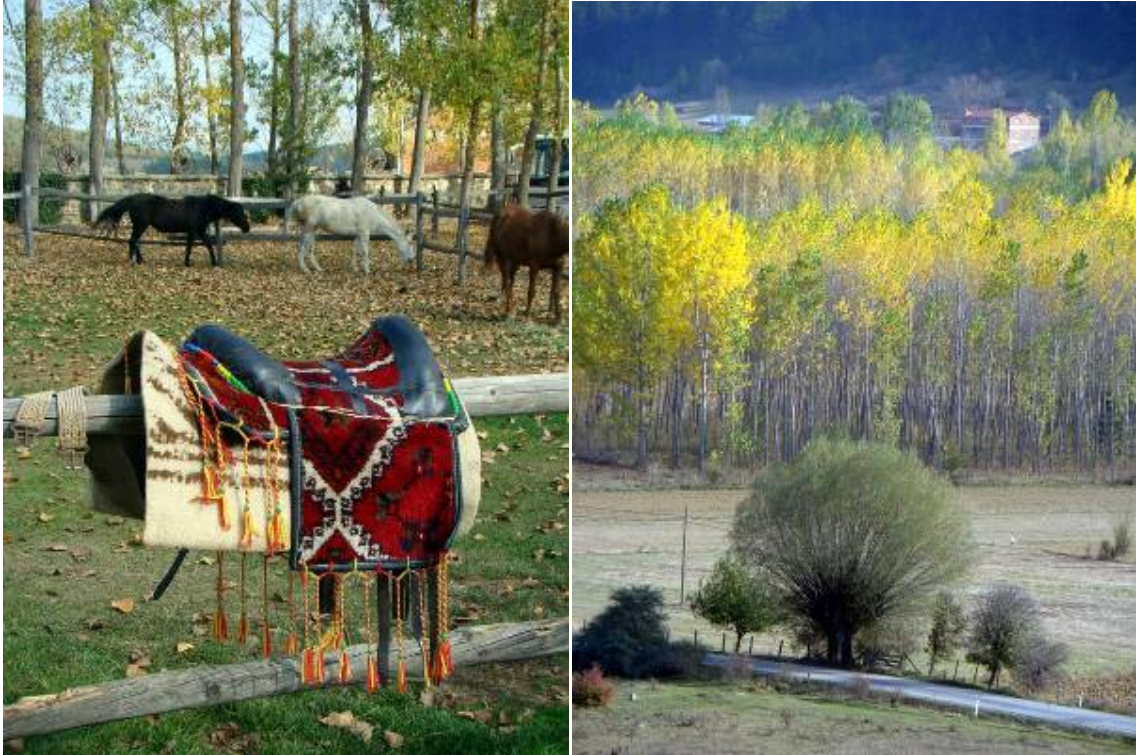
Daday'da at çiftliği

Ilgaz üzerinden geçerek Kastamonu'ya, buradan da oyalanmadan Daday ilçesi yakınındaki Çömlekçiler köyündeki at çiftliğine geçiyoruz. Saat 12.00 gibi çiftlikte oluyoruz. Planladığımız gibi öğle yemeğine yetişiyoruz. Yemek öncesinde bazılarımız hazır at çiftliğine gelmiş iken ata binmeyi yeğlerken bazılarımız da etrafta fotoğraf konuları arıyor.