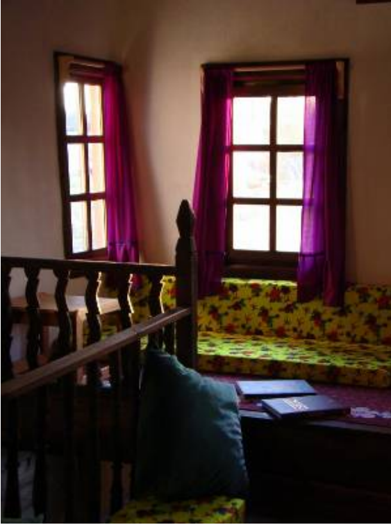
Yanık Ali Konağı, Başören Köyü, Azdavay

Azdavay'ın içinden geçerek Çatak kanyonuna giden patika yolun başına kadar araçla gidiyoruz. Yaklaşık bir km uzunluğunda karışık orman içinden yürüdüktan sonra Çatak kanyonuna hâkim noktaya saat 16.15 gibi ulaşıyoruz. Kanyon çok görkemli ve oldukça etkileyici. Buradan, daha uzakta Valla kanyonunu da görebiliyoruz.