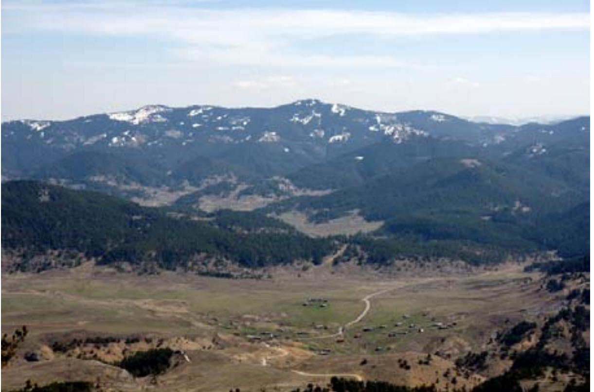
Işık dağı yolundan yayla evleri

Güzergâh üstündeki yaylalardan geçerken erken gelen baharla açan çiçekleri fotoğraflıyoruz, gürül gürül akan çeşmelerden bahar sularını içiyoruz. Zirveye giden araç yoluna çıkıyoruz. Daha önceki gelişlerimizde yaptığımız gibi orman içinden kestirmeden değil de araç yolunu takip ederek zirveye çıkmayı planlıyoruz.