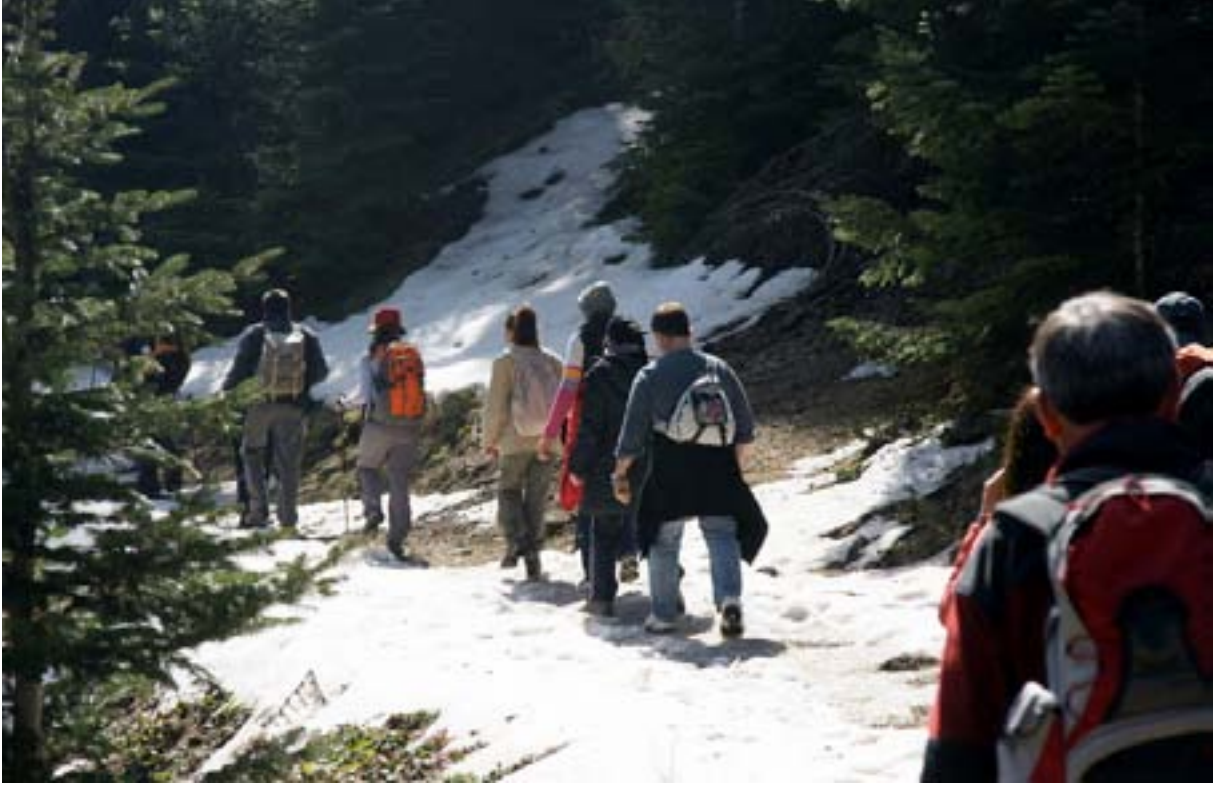
Işık dağına yürürken

Işık dağı yürüyüşlerimize başladığımız Işık dağına giden yol sapağında araçtan iniyoruz. Yürüyüş hazırlıklarımızın ardından saat 10.50'de yürüyüşe başlıyoruz. Aracımız bizi burada bıraktıktan sonra Karagöl'e geçiyor. Zirveye giden araç yoluna paralel olan ancak uzun zamandır kullanılmadığı anlaşılan araç yolundan yürüyoruz. Hava açık, az bulutlu, yürüyüş ve fotoğraf için çok güzel bir gün. Orman içinde güneş görmeyen yerlerde ara ara kar var.