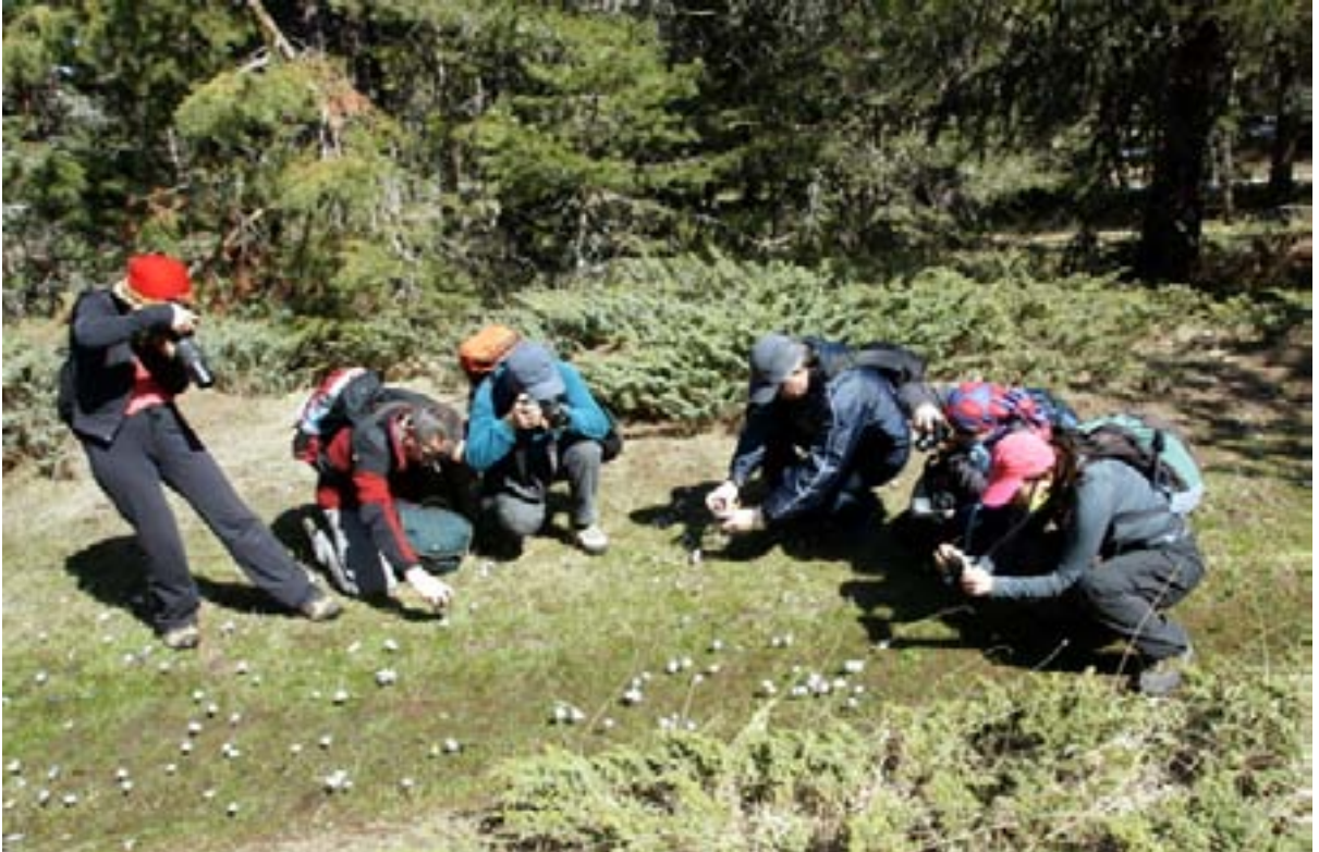
Görüntü toplayıcılar iş başında.

Işık dağı yürüyüşlerimize başladığımız Işık dağına giden yol sapağında araçtan iniyoruz. Yürüyüş hazırlıklarımızın ardından saat 10.50'de yürüyüşe başlıyoruz. Aracımız bizi burada bıraktıktan sonra Karagöl'e geçiyor. Zirveye giden araç yoluna paralel olan ancak uzun zamandır kullanılmadığı anlaşılan araç yolundan yürüyoruz. Hava açık, az bulutlu, yürüyüş ve fotoğraf için çok güzel bir gün. Orman içinde güneş görmeyen yerlerde ara ara kar var.