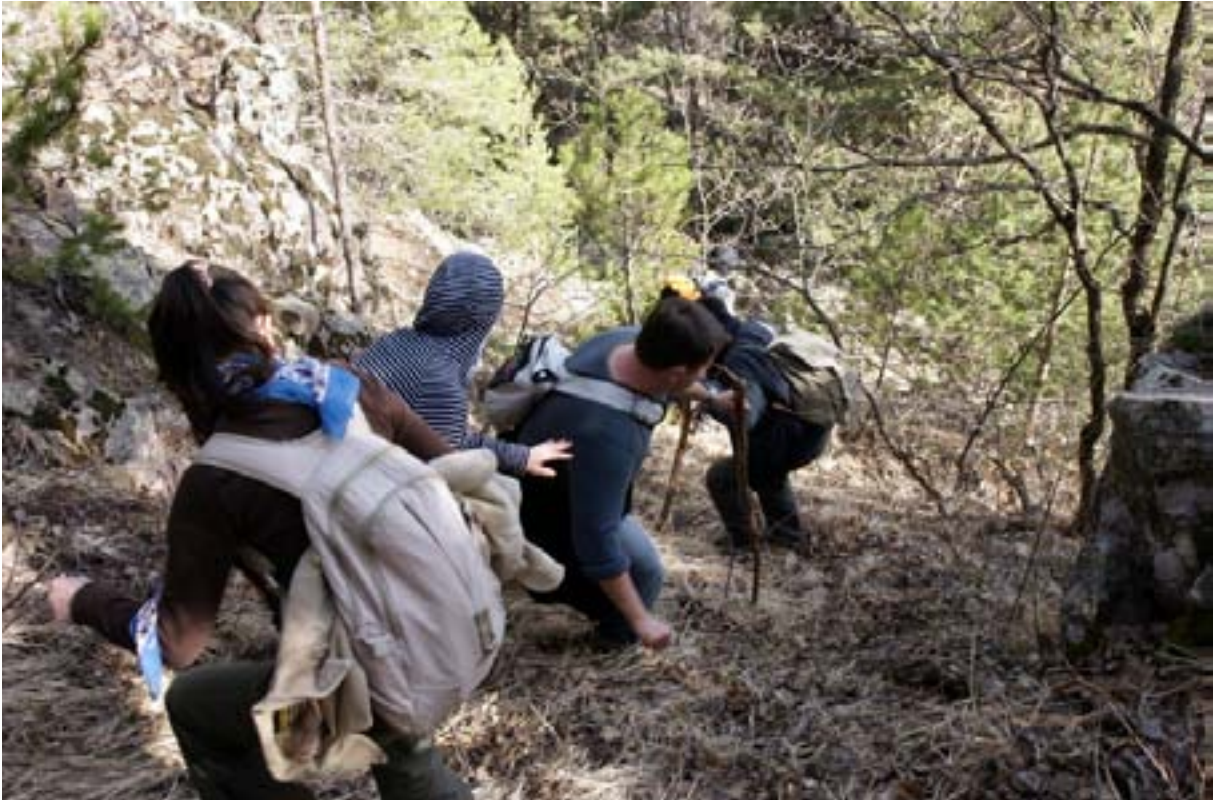
Işık dağı-Karagöl arasını yürürken...

Keyifli bir yürüyüşün ardından saat 13.50'de zirveye ulaşıyoruz. Zirvede keskin bir rüzgar esiyor. Telsiz binasının çevresinde, korunaklı bir yerde yanımızda getirdiğimiz kumanyalarımızı yiyoruz. Zirve keyfini çıkarıp grup fotoğrafı çektirdikten sonra Karagöl'e gitmek üzere saat 14.30'da 14 kişilik grupla orman içinden Karagöl'e doğru yöneliyoruz.