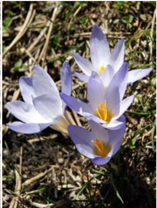
Mor çiğdem (Crocus)

Kızılcahamam'ı geçtikten 5 km sonra yol ayrımından Çerkeş yönüne dönüyoruz. Yol üzerinde Güvem'deki bazalt kayalıklarının önünde bir süre durarak bu ilginç kaya oluşumlarını fotoğraflıyoruz. Yürüyüşçüleri götüren minibüs "Yağcı Hüseyin" yol ayrımından bir müddet daha gittikten sonra Işık dağı zirvesine çıkan yol sapağına kadar gidiyor. Doğrudan Karagöl'e gidecek grubu taşıyan minibüsler ise Yağcı Hüseyin köyüne doğru gidiyor.