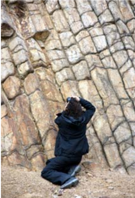
Güvem bazalt kayalıkları

Saat 07.40 gibi FSK önünden yola çıkıyoruz. Yaklaşık 80 kişilik bir katılım var, 3 araç ile gidiyoruz. Bu yoğunluk FSK için de bir ilk. Yol üzerinden binecek katılımcıları da aldıktan sonra E-5 otoyolunu takip ederek Kızılcahamam'a ulaşıyoruz.