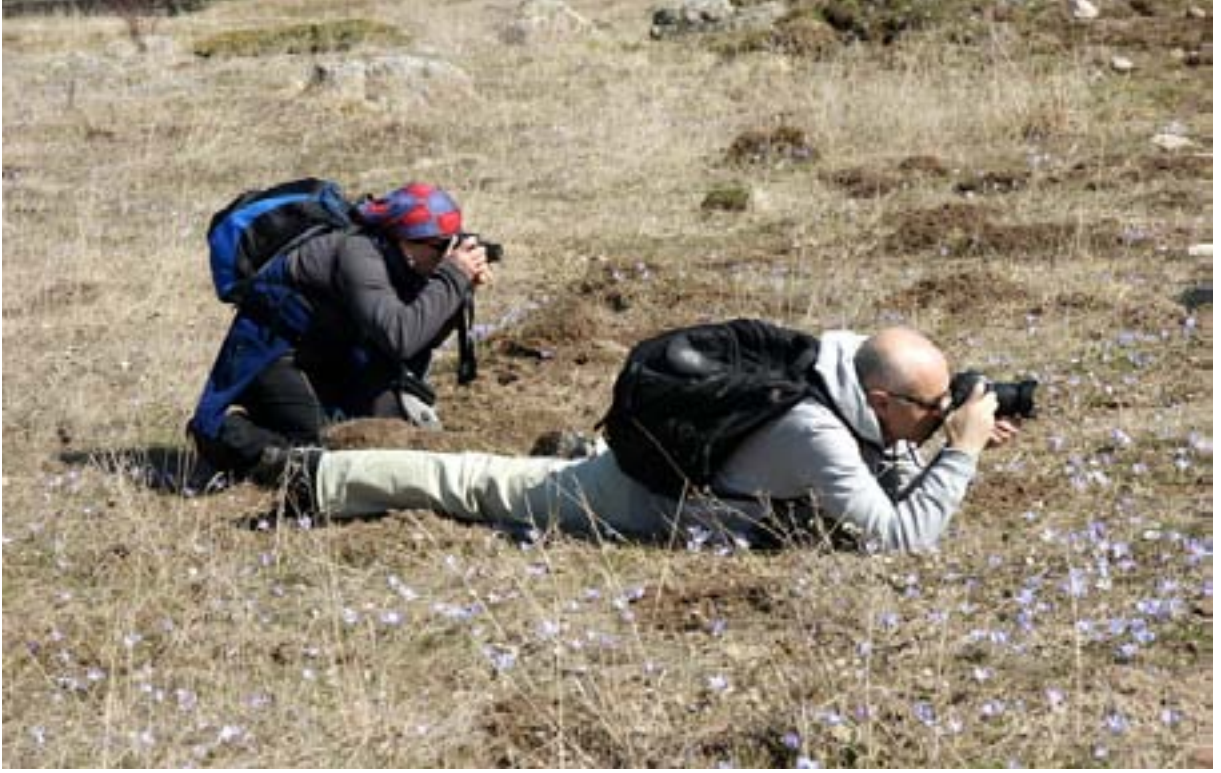
Konu fotoğraf olunca...

Güzergâh üstündeki yaylalardan geçerken erken gelen baharla açan çiçekleri fotoğraflıyoruz, gürül gürül akan çeşmelerden bahar sularını içiyoruz. Zirveye giden araç yoluna çıkıyoruz. Daha önceki gelişlerimizde yaptığımız gibi orman içinden kestirmeden değil de araç yolunu takip ederek zirveye çıkmayı planlıyoruz.