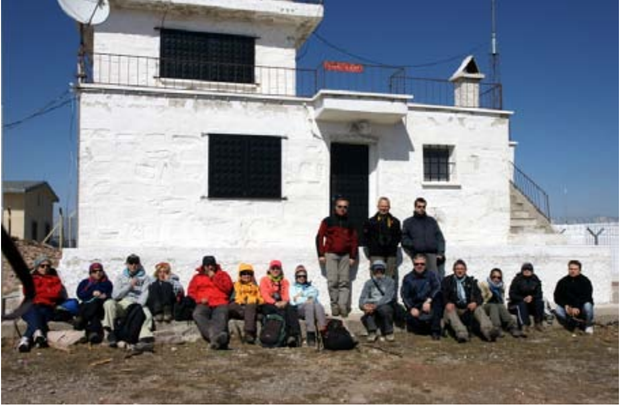
Işık Dağı zirve (2034 m)

Keyifli bir yürüyüşün ardından saat 13.50'de zirveye ulaşıyoruz. Zirvede keskin bir rüzgar esiyor. Telsiz binasının çevresinde, korunaklı bir yerde yanımızda getirdiğimiz kumanyalarımızı yiyoruz. Zirve keyfini çıkarıp grup fotoğrafı çektirdikten sonra Karagöl'e gitmek üzere saat 14.30'da 14 kişilik grupla orman içinden Karagöl'e doğru yöneliyoruz.