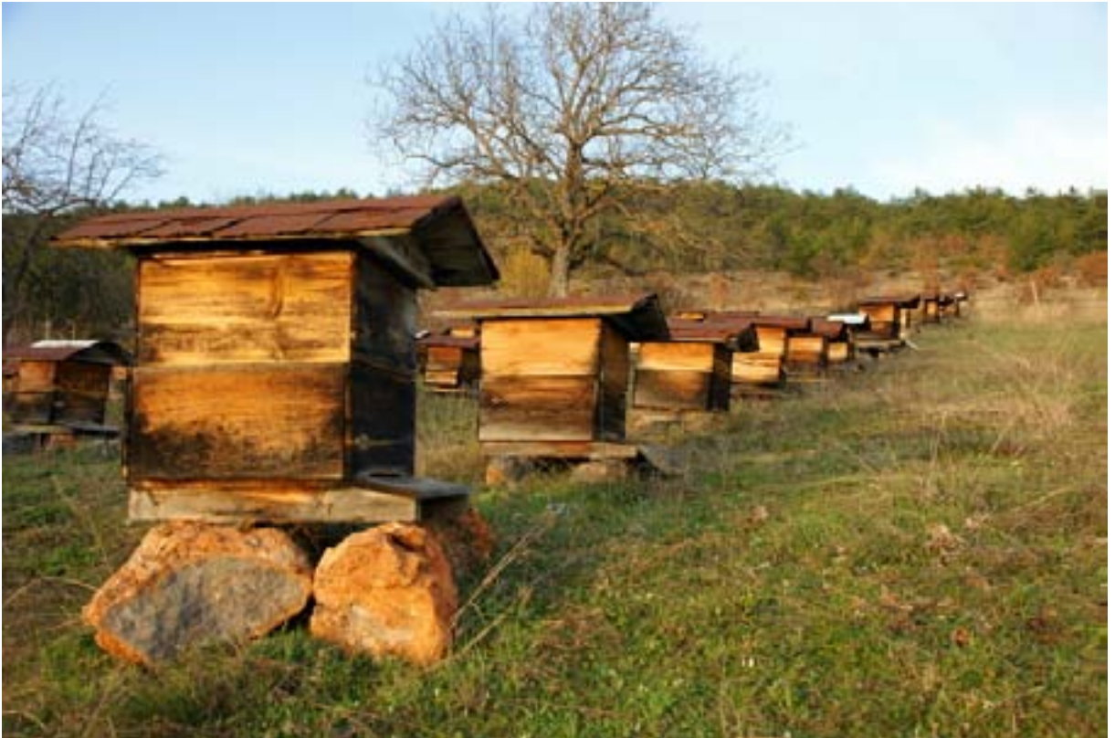
Çırdak köyü-Mengen, Bolu