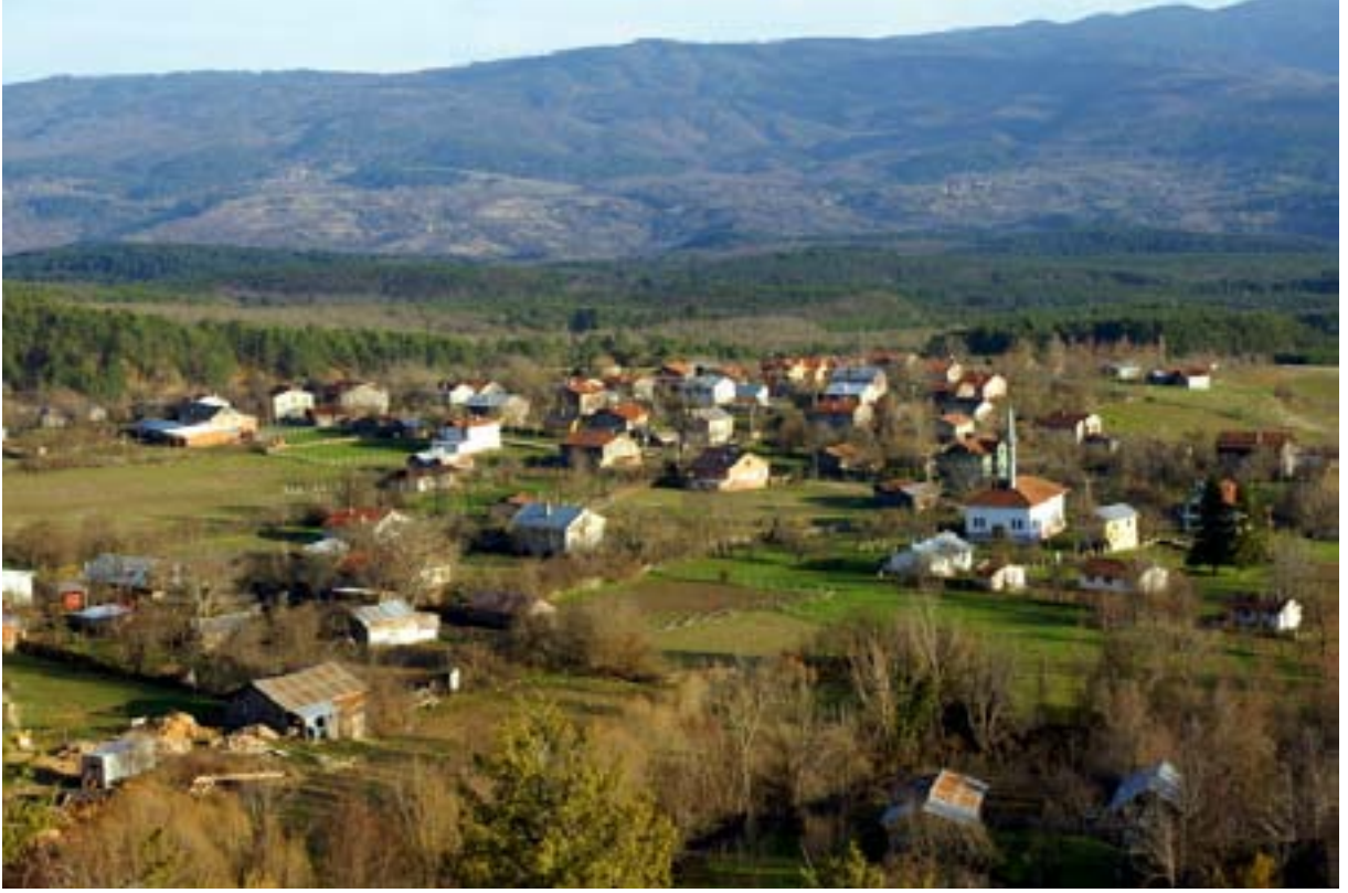
Bürnük köyü-Mengen, Bolu