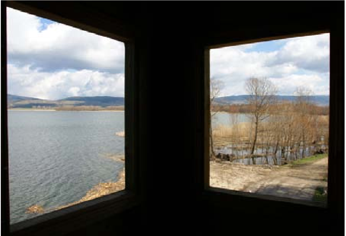
Seyir terasından Yeniçağa gölü-Yeniçağa, Bolu