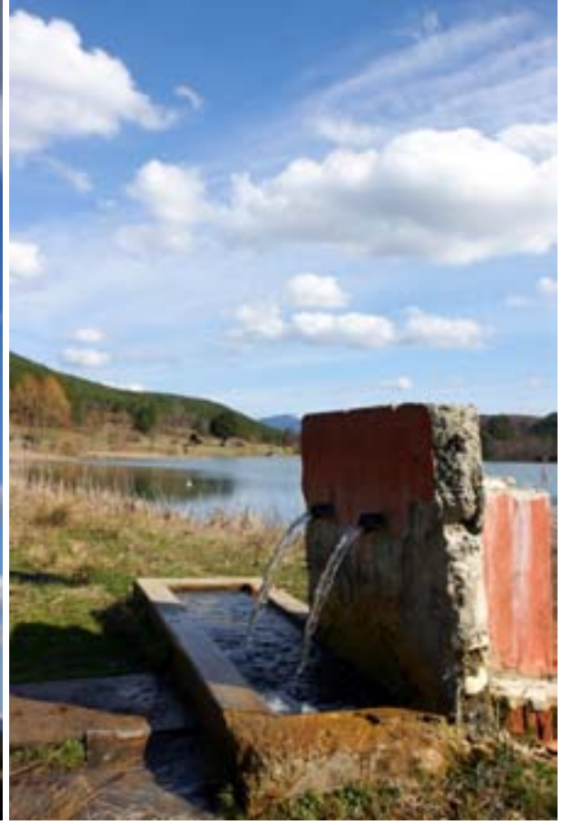
Bürnük Gölü-Mengen, Bolu

Saat 14.45 gibi Bürnük göletinin girişine ulaşıyoruz. Burada gördüğümüz ve birçoğumuz için yeni olan ebe çamı ve çayırda açmış siklamenleri, çiğdemleri ve çuha çiçeklerini fotoğrafladıktan sonra gölete kadar yürüyoruz. Bizden başka bir-iki grup da piknik için burada. Bürnük göletini turlayıp ilginç bulduklarımızı fotoğraflıyoruz. Kalan zamanımızda da toprak araç yolu boyunca yürüyüş yapıyoruz. Gün ışığından daha çok faydalanıp yolumuzun üstünde fotoğraf yakalamak için karanlığa kalmadan saat 17.30 gibi göletten ayrılıyoruz. Bürnük köyünün üstünden geçerken kısa bir mola verip köyü yukarıdan fotoğraflıyoruz. Bu seyir noktasında tümüyle ağaçtan yapılmış özgün bir çocuk parkı var.