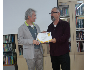
18 Ekim Yabancı Fotoğraf Sanatçılarından Sunumlar "Syed Javaid A. Kazi - Cultural Diversity"