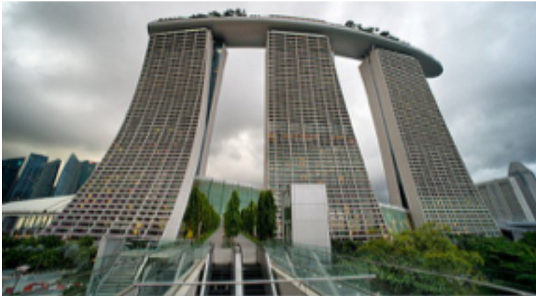
Lens Shift +6mm